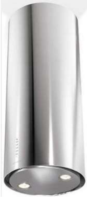
Ref. CYLINDRA ISOLA